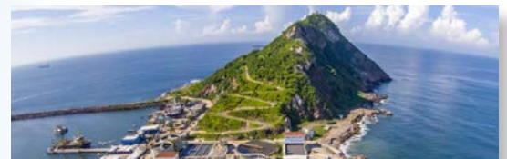
PUERTO VALLARTA, JALISCO